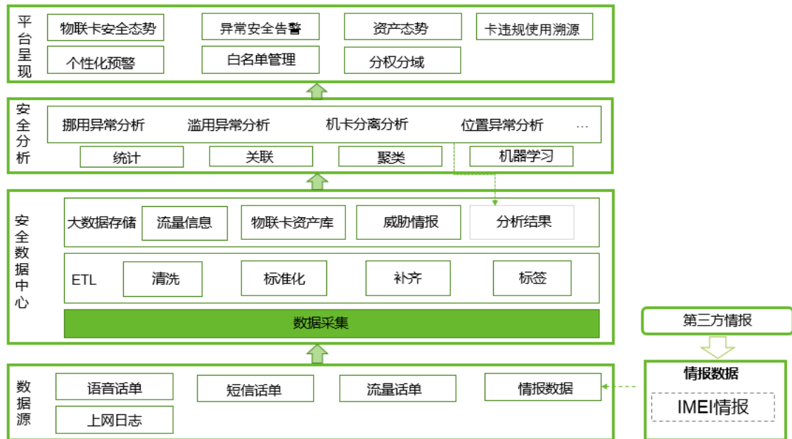
图表 1 绿盟物联网安全风控平台架构示意图